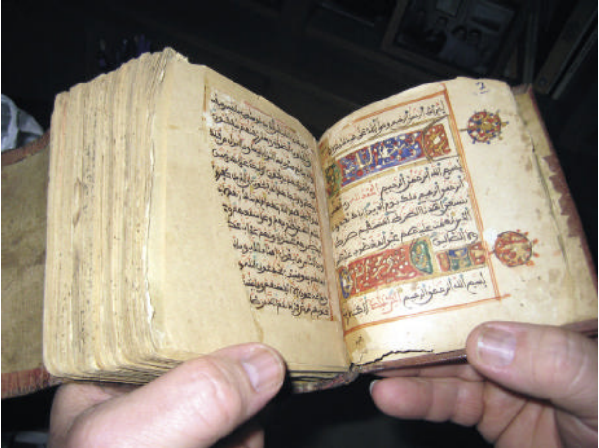
Lectura sagrada islámica

lagueño era el walí de origen beréber 'Abd Allah b. 'Al Ibn Zannun —según nos dice Ibn Jamis, sobrino de Ibn 'Askar— pues quería hacerse con el poder absoluto de Málaga. Para ello «continuó empleándose, juntamente con el grupo de sus partidarios, contra Ibn al-Hasan, hasta eliminarlos a todos, uno por uno, valiéndose del destierro, del asesinato o metiéndolos en prisión indefinidamente. Así la ciudad quedó bajo su poder y nada se hacía sin consultarle» 7 . Asesinado Ibn Hud, la región se sometió a los Nazaríes y los malagueños mataron a Ibn Zannun.