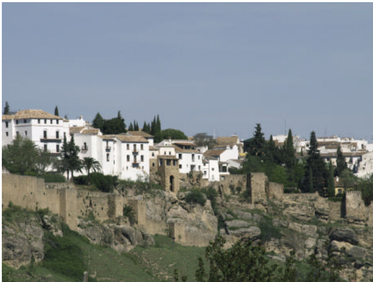
Muralla de Ronda