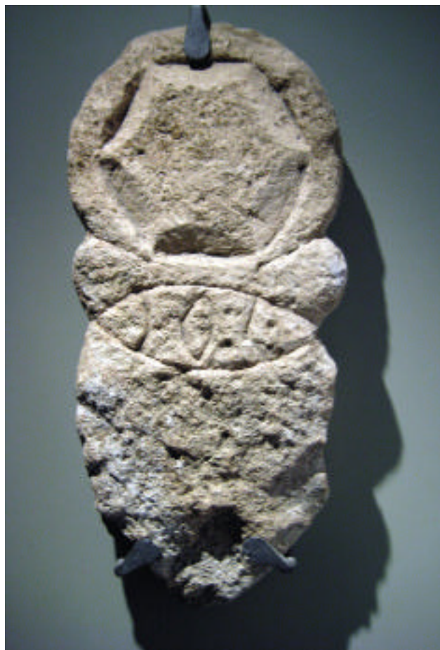
Estela funeraria (Museo de Ronda)